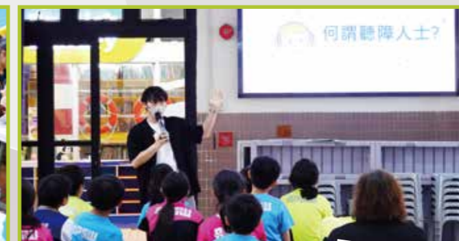
義工計劃體驗講座