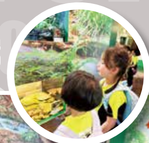
同學細心觀察珍稀動物