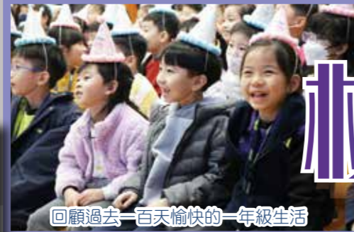
回顧過去一百天愉快的一年級生活