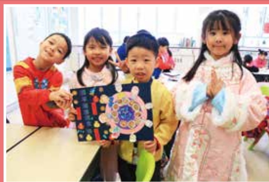
同學合力完成一幅螺鈿年畫