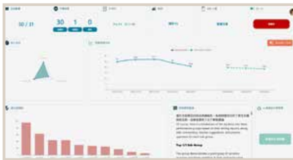
Class-based comments and analysis