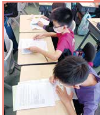
個別化的 AI 作文建議，有助學生精進作文