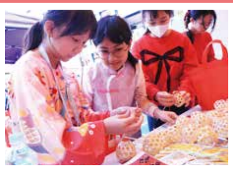
親手製作竹編燈籠，感受非遺魅力