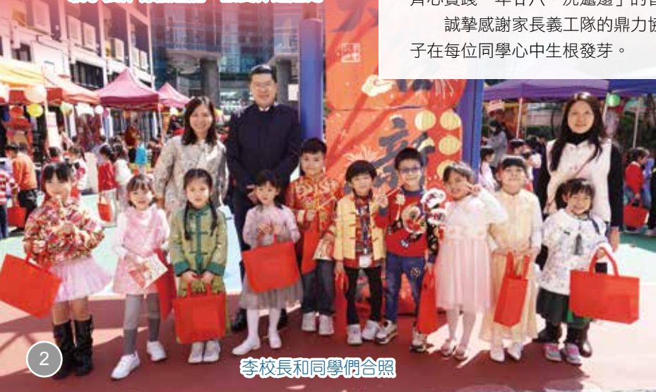
李校長和同學們合照