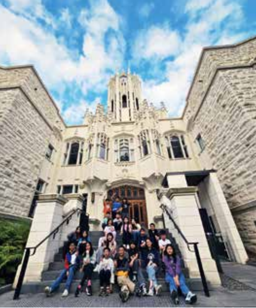
Our students look toward a bright future while visiting the iconic Clock Tower at the University of Auckland.