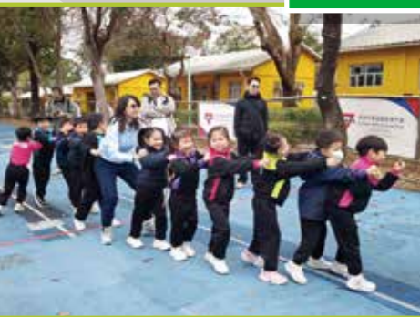
老師跟同學們一起玩集體遊戲