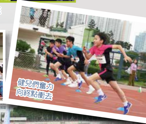
健兒們奮力向終點衝去