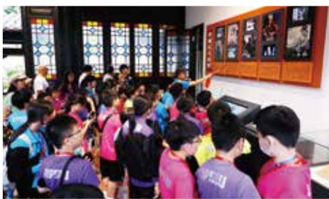
同學參觀粵劇博物館，了解粵劇名伶的歷史