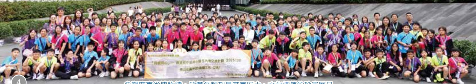
參觀廣東省博物館，欣賞各類型具廣東歷史、文化價值的珍貴展品