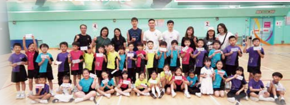
香港精英運動員與二年級得獎同學合照