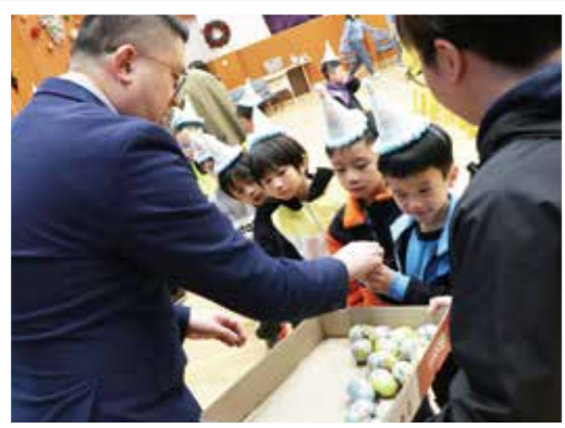
校長送給各位小一的「百日禮物」