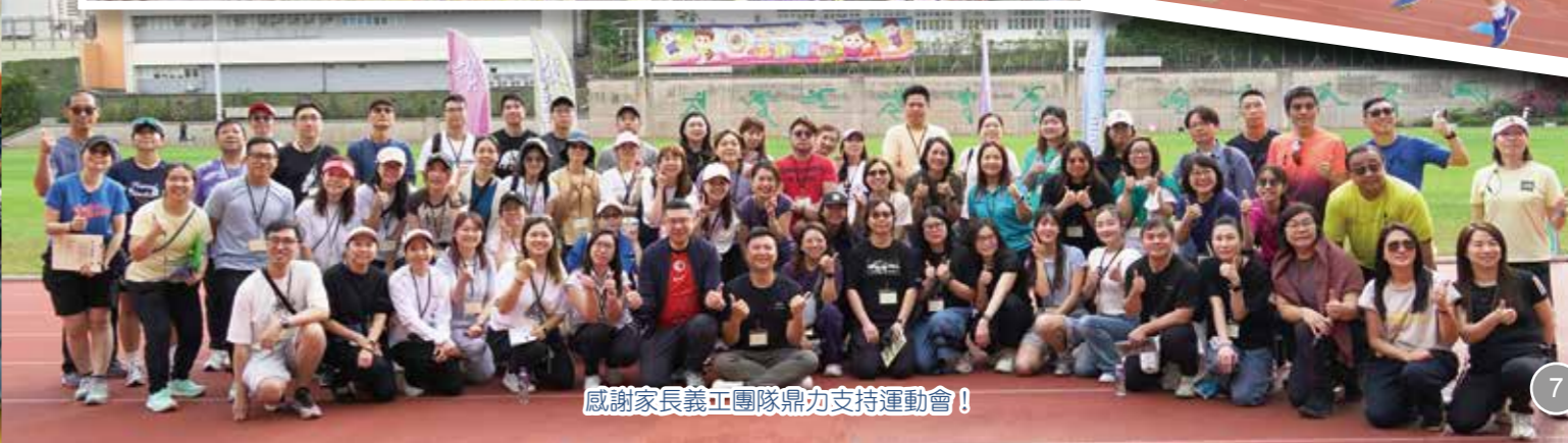
感謝家長義工團隊鼎力支持運動會!