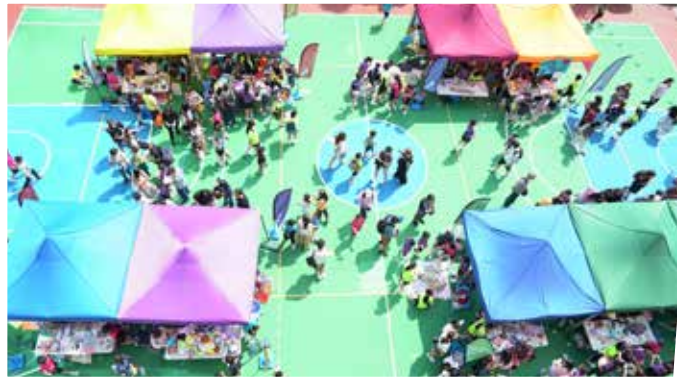
感謝天父賜予美好的天氣，人潮絡繹不絕