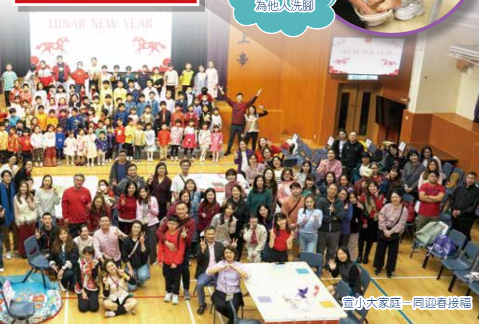
宣小大家庭一同迎春接福