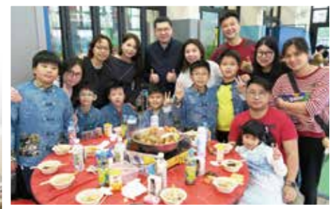
迎接新年當然少不了盆菜宴!