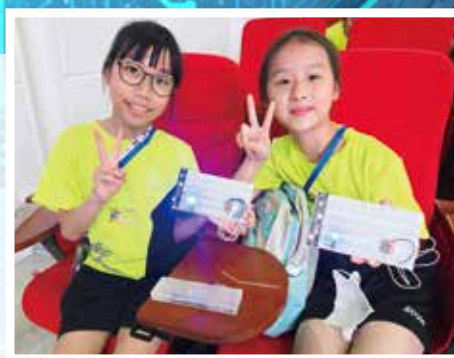
學生製作電路組件，體驗製作的艱難