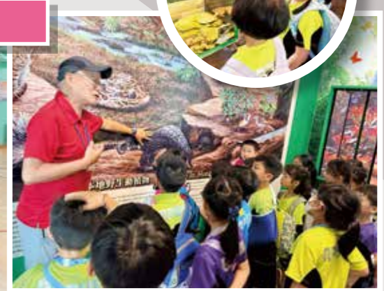
一、三年級得獎同學參觀林邊生物多樣性自然教育中心