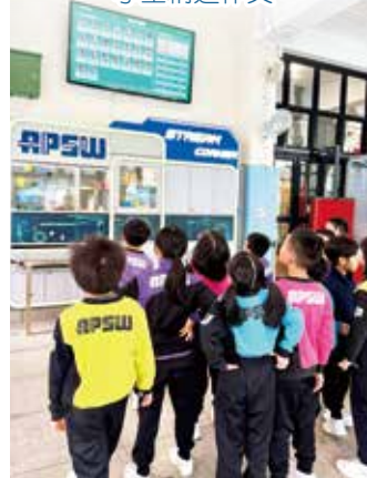
體育課堂進行耐力跑後，同學可以於螢幕即時看到成績