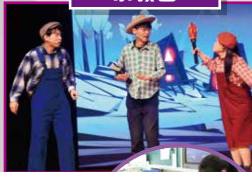
循道衛理佈道團到校與學生分享福音信息