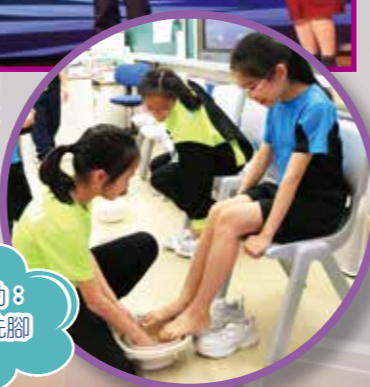
體驗活動8 為他人洗腳