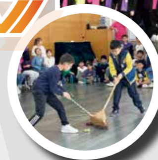
緊張刺激的掃把球比賽