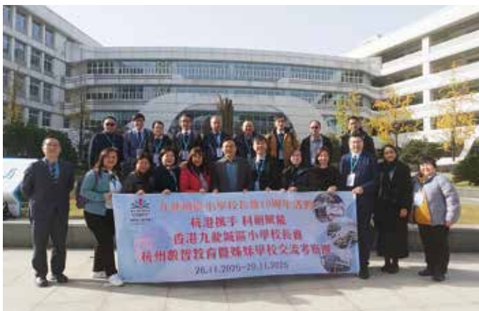
李校長在中國杭州的學習交流