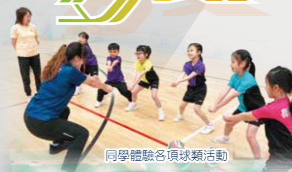
同學體驗各項球類活動