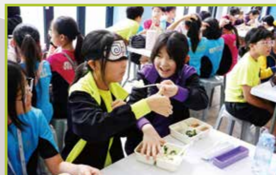
同學體驗蒙眼午餐