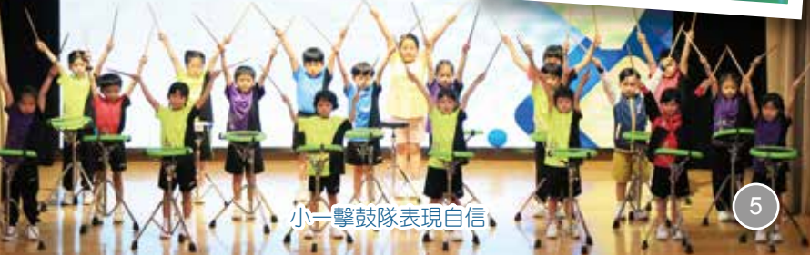
小一擊鼓隊表現自信