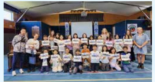
Our young explorers celebrating their final day at Waipahihi School.

The profound impact of this trip was evident in the smiles and laughter shared throughout. Many students enjoyed the experience so deeply that they wished the journey would never end. This was more than just a trip; it was a stepping stone toward becoming confident global citizens .