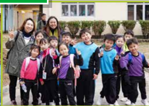
家長與師生共度歡樂的旅行日