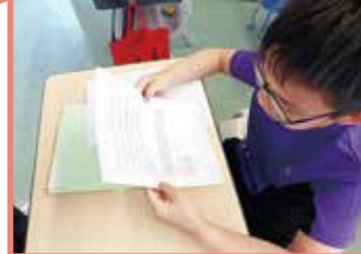
同學們正認真閱讀 AI 作文評語