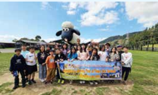
The group shares a joyful moment alongside a giant sheep at the Agrodome, celebrating the beauty of New Zealand's farm life.