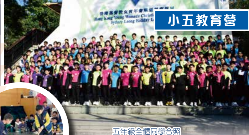
五年級全體同學合照