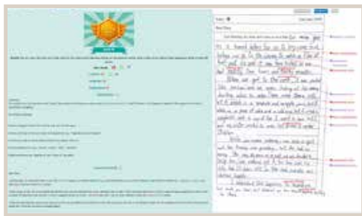
Individualised learning and self-directed learning.

緊接語文科的步伐，體育科亦迎來了科技變革。為了提升同學的運動興趣，並讓評估更科學與數據化，新增了 50 米短跑和耐力跑兩項 AI 體育設備。系統能精準分析，幫助同學提升爆發力及心肺耐力。從語文寫作到操場鍛鍊，AI 助同學建立活躍健康的生活。