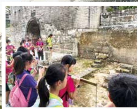
認識南頭古城的規劃及重建